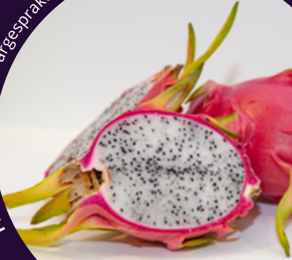
Pitahaya/dragefrukt: Fargesprakende og mild.