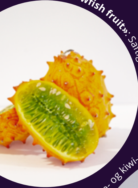
Kiwano/«Blowfish fruit»: Saftig og søt.